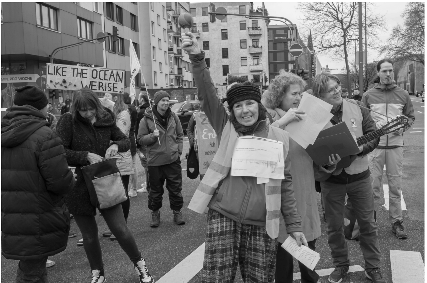
“Klimaschutz” als Menschenrecht: Nächster Etappensieg für die ökosozialistische Sekte

von Jason Ford (https://ansage.org/author/jason-ford/) - 09. April 2024 (https://ansage.org/2024/04/09/)