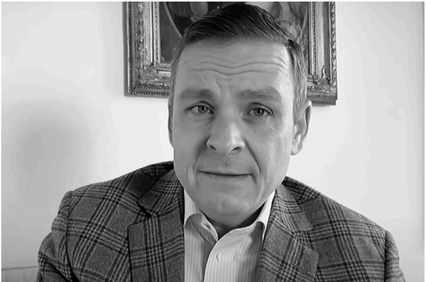
Scharfzüngiger Ösi-Grantler und begnadeter Polit-Satiriker: Justizopfer Gerald Grosz

Am Montag wurde wieder einmal deutlich, dass deutsche Gerichte die AfD nicht nach den Maßstäben beurteilen, die sie bei Politikern der Kartellparteien anwenden. Der österreichische TV-Moderator, Publizist und Ex-Politiker Gerald Grosz wurde vom Amtsgericht Deggendorf zu einer sagenhaften Geldstrafe von 14.850 Euro (90 Tagessätze à 165 Euro) verurteilt ( https://www.bild.de/regional/muenchen/muenchen-regional-politik-und-wirtschaft/oesi-politiker-wegen-soedolf-rede-verurteilt-14-850-euro-geldstrafe-87800732.bild.html ). – weil er den bayerischen Ministerpräsidenten Markus Söder in einer Rede beim politischen Aschermittwoch der AfD im Februar 2023 in Osterhofen als „Södlf“, „Corona-Autokrat“ und „Landesverräter“ bezeichnet hatte. Die Generalstaatsanwaltschaft München klagte Grosz daraufhin unter anderem wegen Beleidigung, Verleumdung und übler Nachrede an. Den Begriff „Södlf“ verstehe man als „Nazi-Parole und rechtsextremistische Verleumdung“, hatte die Bayerische Staatskanzlei erklärt. Auch Gesundheitsminister Karl Lauterbach hatte Anzeige erstattet, weil Grosz ihn in derselben Rede als „Horrorclown“ bezeichnet hatte.